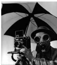
David e Scherman Dressed for war. London 1943

La mostra convida a descobrir les activitats del cercle surrealista en terres britàniques des de la mirada d'una de les seves integrants més destacades, la fotògrafa Lee Miller.