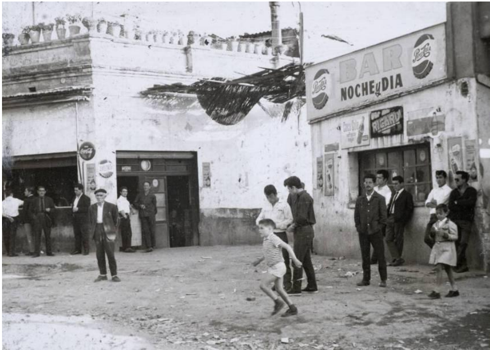
Can Valero a Montjuïc, anys 50. 'El barraquisme en Montjuïc.' Marcial Echenique. Arxiu Municipal Contemporani de Barcelona

Montjuïc va ser la zona de màxima concentració de barraques al llarg del segle XX, amb nombrosos nuclis en tots els vessants de la muntanya. Els barris més grans eren els de Can Valero i Tres Pins , a la zona on actualment hi ha el Jardí Botànic. Altres nuclis destacats eren els de les Banderes, Damunt la Fossa i l'Esparver, la Vinya, Magòria i les barraques de Maricel . Al litoral hi havia els barris de Can Tunis o Jesús i Maria i el Morrot . En el moment de màxima extensió del barraquisme, la població a la muntanya va assolir una xifra d'unes 50.000 persones i unes 8.000 barraques .