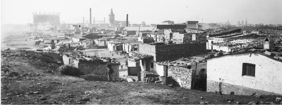
Barri del Somorrostro, c. 1950.