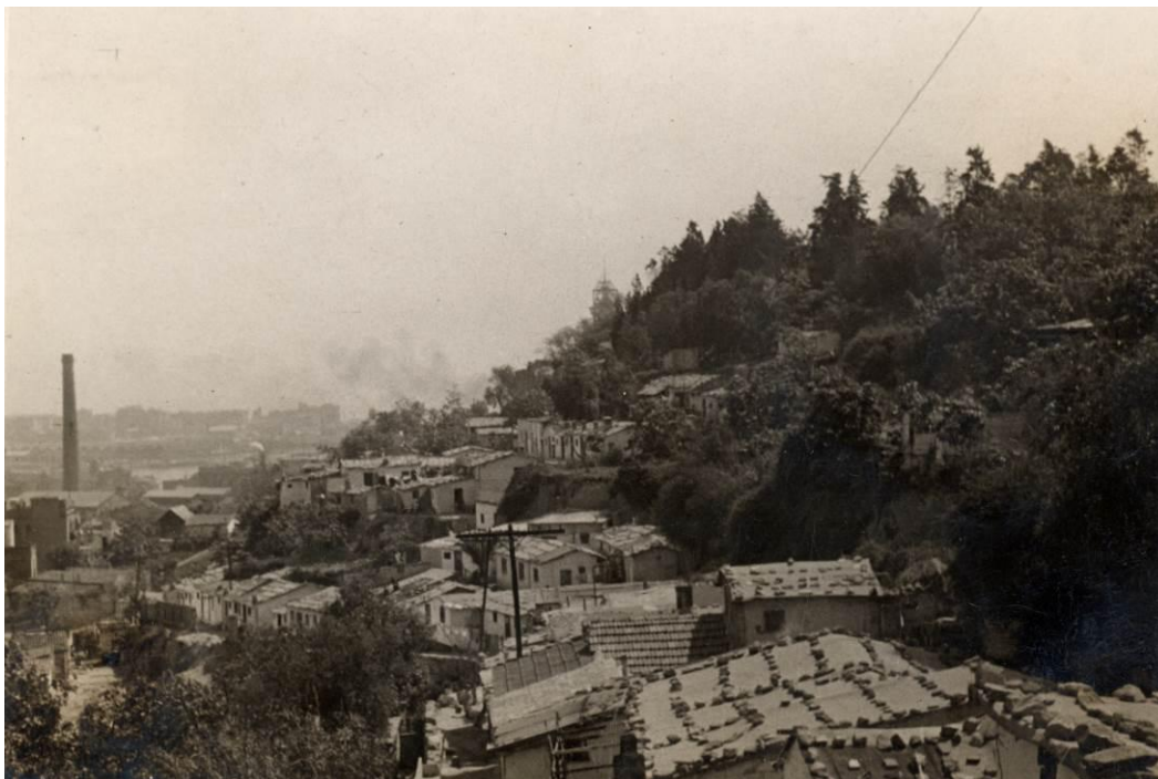
Barraques del barri de la Primavera, 1952.

Cal recordar els nuclis del passatge de la Vinyeta, el de l'esquerra de la carretera del castell, el del passeig de Montjuïc, fins al carrer Nou de la Rambla, on es van assentar unes vint famílies de cultura gitana, ben documentades pel fotògraf Jacques Léonard. Al capdamunt dels carrers del Poble-sec i per sota de l'avinguda de Miramar hi havia nuclis com el de la Satalia. El 1960, la xifra de barraquistes superava les 6.000 persones.